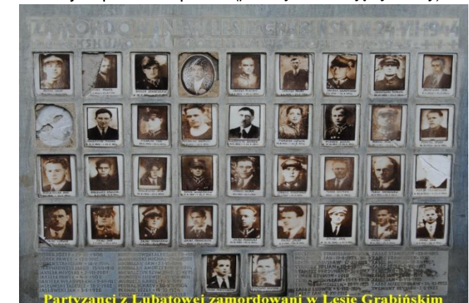
Partyzanci z Lubatowej zamordowani w Lesie Grabińskim

Pomnik postawiony w 1947 roku zawierał dwie tablice ze zdjęciami i nazwiskami poległych w walce lub zamordowanych przez okupanta. (poniżej widok zdjętej tablicy)