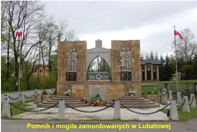
Pomnik i mogiła zamordowanych w Lubatowej

Niszczycielskie działanie czasu spowodowało, że tablice ze zdjęciami zastąpiono tablicami (zdjęcia tablic w tekście) z wykazem nazwisk lubatowian poległych i zamordowanych w czasie wojny i okupacji. (poniżej pomnik w 2019 r.)