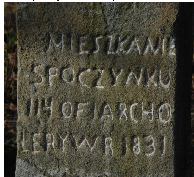
Inskrypcja na pomniku ofiar cholery z 1831 r.